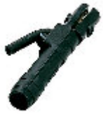
DALLAS 300 PINZA PORTAELETTRODI 300A 712260