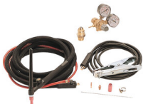
WIG SCHWEISSKIT - ST9V 801097