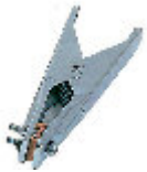
TOLEDO 250 MASSEKLEMME 250A 712030