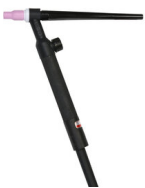
ST9V WIG BRENNER AX25 4M 722563