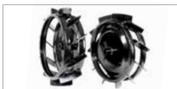
Coppia ruote metalliche Ø 370 mm Codice L0051200