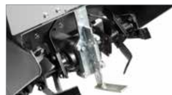
Regolazione della profondità della fresa per utilizzo su ogni tipologia di terreno.