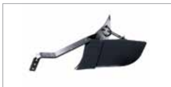
Assolcatore retrofresa Codice 69209111