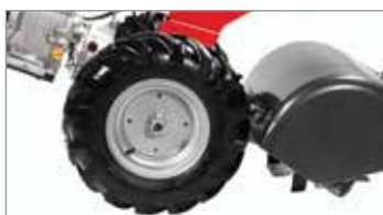
Ruote di grandi dimensioni per facilitare la manovrabilità della macchina durante l'utilizzo.