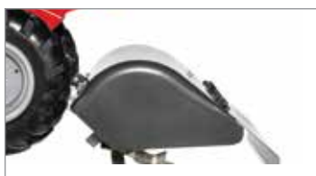
Fresa da 50 cm controrotante che facilita il lavoro su terreni particolarmente difficili.